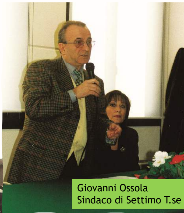
Giovanni Ossola Sindaco di Settimo T.se

SETA S.p.A. venne costituita nel novembre 2002 dall'unione dell'Azienda A.I.S.A. e del Consorzio C.A.T.N. con la partecipazione azionaria di AMIAT S.p.A.